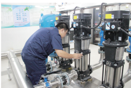
二次供水泵房检查维护