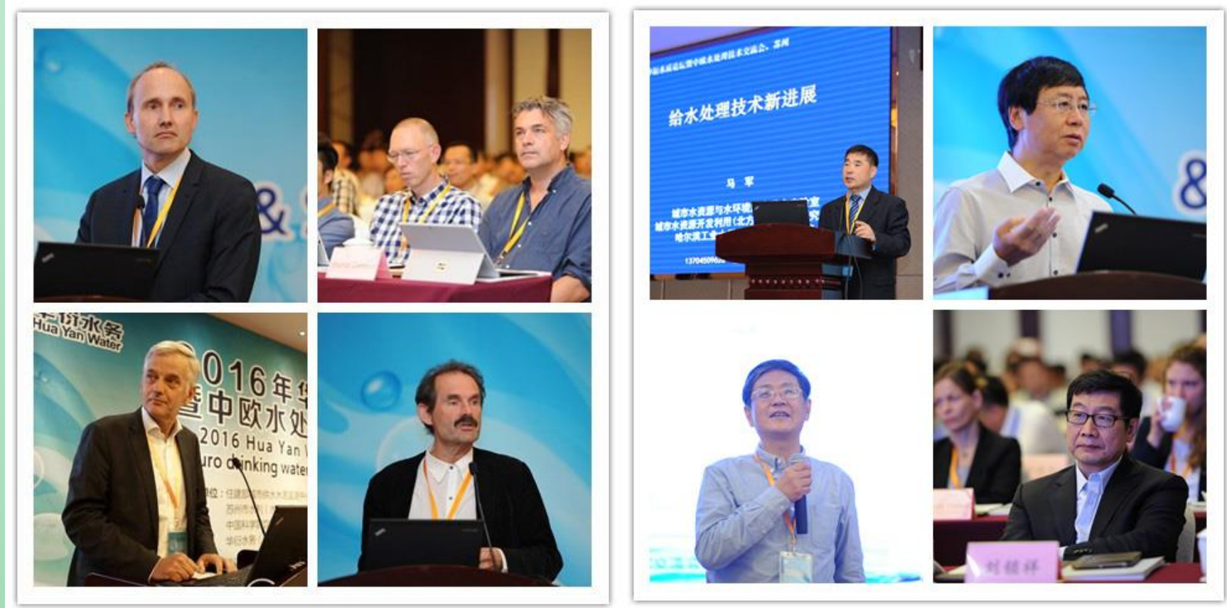
中、欧知名水处理专家做专题分享

本届论坛由住建部城市供水水质检测中心、江苏省城镇供水安全保障中心、苏州市水利（水务）局、《中国给水排水》杂志社、中国科学院饮用水科学与技术重点实验室、同济大学环境科学与工程学院、华衍水务（中国）有限公司联合主办，来自政府、国内外高校研究机构及水务公司等多个方面的逾300位嘉宾共同参与，就各国饮用水处理技术、净水新方法、水源至龙头全过程水质管理策略、输配水管网精细化管理、水厂制水净水优化、二次供水管理等饮用水安全保障领域内的热点问题，展开了深入的探讨和交流分享，共同探求饮用水水质管理水平的全面提升。