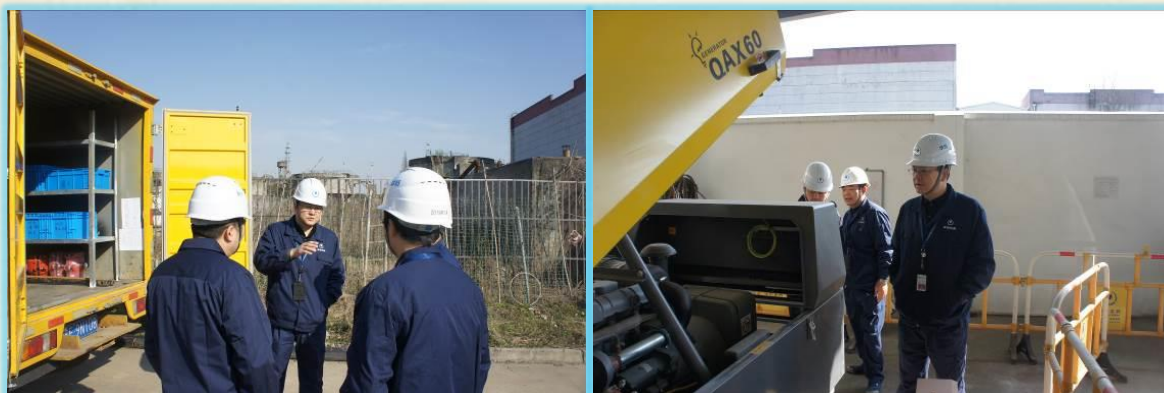
汤阳总经理在北区抢维修中心八拆仓库和苏州市政盛泽抢维修仓库检查