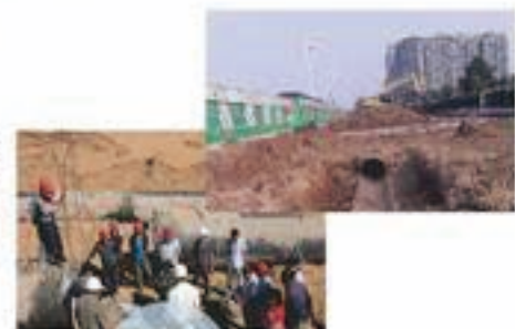
大口径PCCP管自集料混凝土管

PCCP管是O型胶圈属于半柔性接口,能适应管子轴向位移,但承担管基不均匀沉降性能差,故管道基础比钢管、球铁管及一阶段、三阶段预应力管要求较严,通常在较硬的沟底应作砂垫层,软一点管基需做混凝土基础处理费用大。见右图: