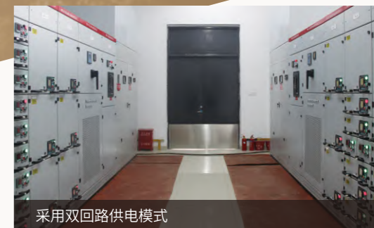
采用双回路供电模式