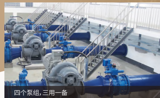
四个泵组，三用一备