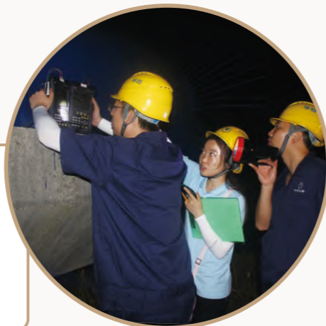
夜间台阶测试,明确问题管段

奔走的检漏师们,从一个地点快速奔赴下一个地点,加强管网巡查、听漏,对管线、消防栓、阀井进行巡视检查,及时修理更换,排除隐患,确保管线安全。巡线到位率98.2%(考核指标95%),其中,一级巡线里程达到25312公里。