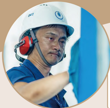
值班人员带着降噪耳机正在清洁泵组

今年夏天,持续的高温带来用水高峰,七、八月间,日均供水量为66.69万吨,最高日供水量71.67万吨。吴江华衍水务多措并举,从生产、供水、服务、应急保障等各个方面全力保障高峰供水安全平稳。