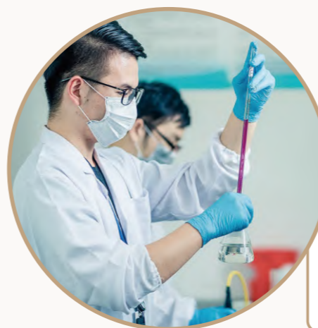
水质检测员在进行水质检测