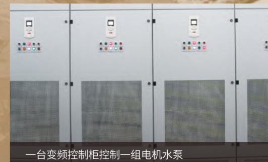
一台变频控制柜控制一组电机水泵

汾湖泵站采用双回路供电模式，每一组电机水泵均由一台变频柜控制，四个泵组三用一备，有效提升泵站应对突发状况的能力，降低运行风险，保障供水工作的顺利进行。