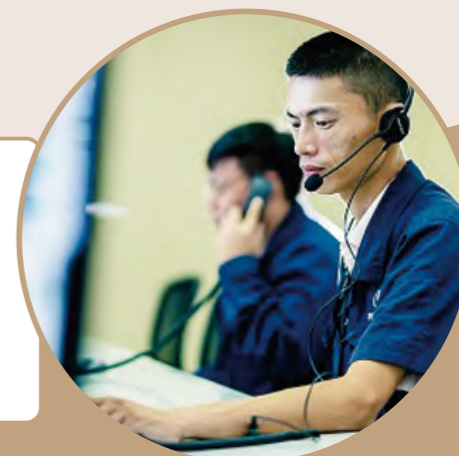
调度员在线监测数据

水厂制水设备错峰运行维护,将滤池冲洗、沉淀池吸泥行车等正常维护都安排在凌晨进行。在应急调度方面,吴江华衍水务已形成双水厂供水模式,且连接吴中区的DN1200应急联通管道也一直处于备用状态,可以满足全区夏日供水需求。